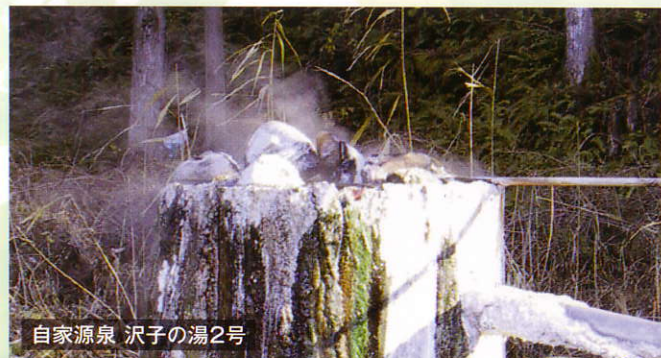
自家源泉 沢子の湯2号