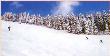
鬼首・上野々スキー場